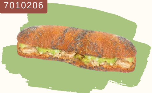
Le Croque Monsieur Paillasse®